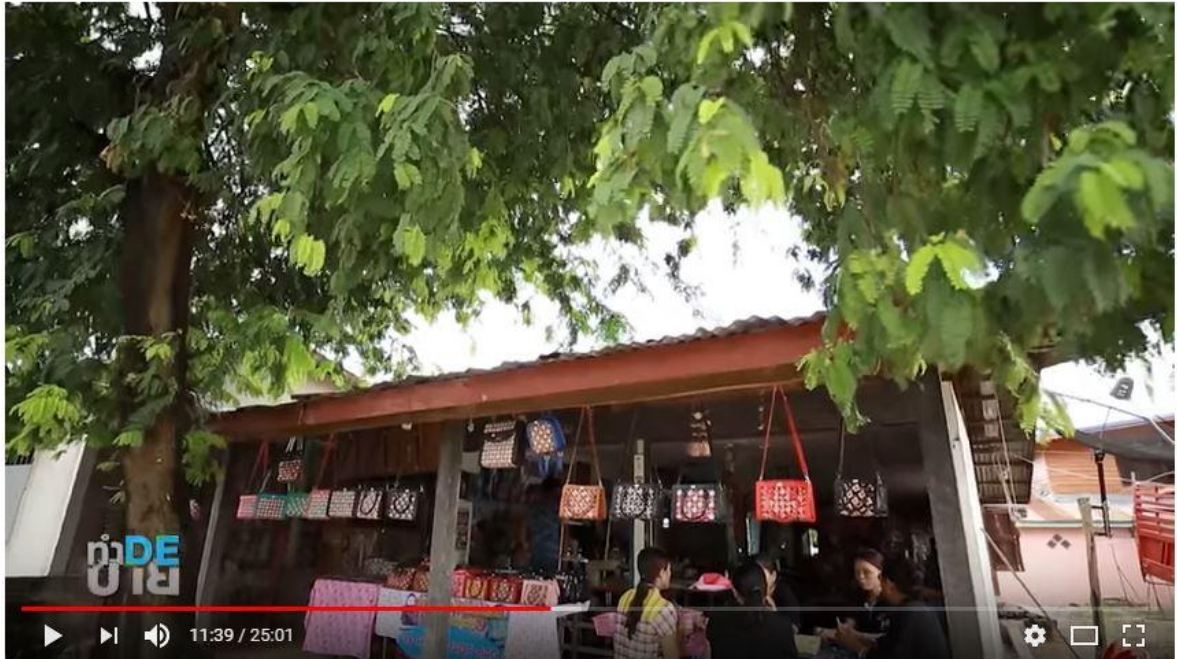
รายการ "ทำDE ขายดี" ตอน "ชุมชนตำบลบัวคำ ยุคเทคโนโลยีดิจิทัล"