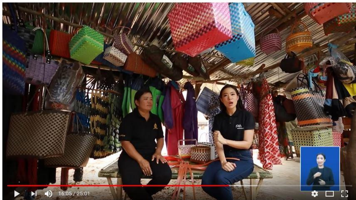
รายการ "ทำDE ขายดี" ตอน "ชุมชนตำบลบัวคำ ยุคเทคโนโลยีดิจิทัล"